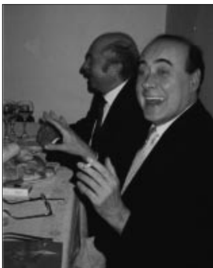
Victor, allegria a tavola