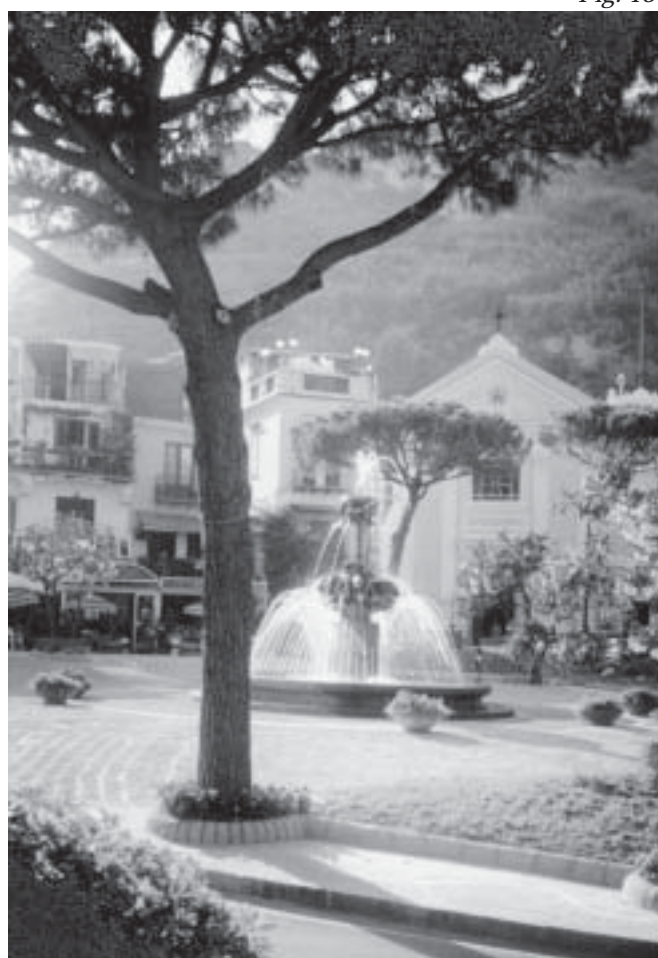
Fig. 17- "Al bordo di una dolce piazzetta - anni 50-60" Fig. 18- "Al bordo di una dolce piazzetta - 1999"

Richiamate dal rintocco delle campane, tante figure piccole, curvate dagli anni e da tante illusioni spezzate, si trascinano verso il portico come incantate. Uomini dai capi coperti, donne ammantate di nero pro-